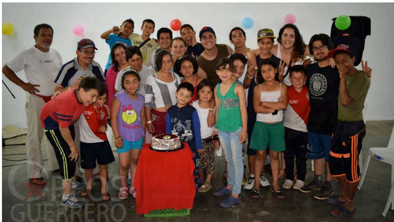
Foto de grup del campament juvenil en el que vam participar.

Per començar a entrar en contacte amb el viatge que m'esperava, vaig consultar blogs de persones que han realitzat el mateix programa. També vaig entrar a un parell de grups de Facebook d'espanyolxs a Colòmbia o Bogotà, que m'han pogut resoldre dubtes concrets de persones en situació d'estrangeria. Això és el suport que vaig buscar pel meu compte, però també compto amb l'assessoria de la tècnica internacional d'Esplac i persones properes del meu entorn que han viscut l'experiència de l'EVS.