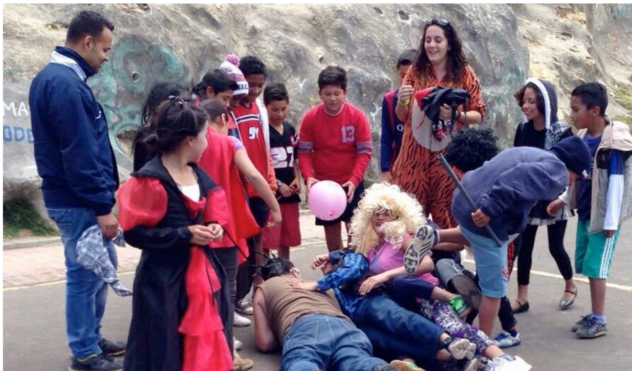
Celebrant Halloween amb una gimcana. Els hi vaig ensenyar a jugar a "la Figa", un joc bastant popular a Catalunya.

En una experiència així, sento una sensació de llibertat, que tinc l'oportunitat de fer el que m'agrada. Una oportunitat a la que ara, aquí, més que mai, me n'adono que no tothom hi té fàcil accés. Són coses que una recorda tota la vida, i on et demostres què ets capaç de fer, o què és el que més t'afecta i sobretot, reflexiones constantment sobre el que vols fer amb la teva vida. T'ajuda a escapar de la rutina i a obrir la ment a coses noves.