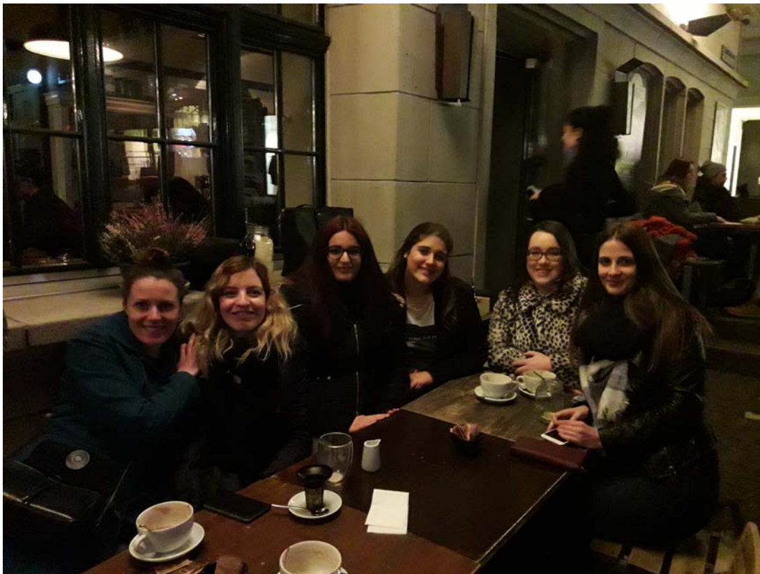
Prenent un cafè en una trobada d'Au Pairs que jo mateixa vaig organitzar.