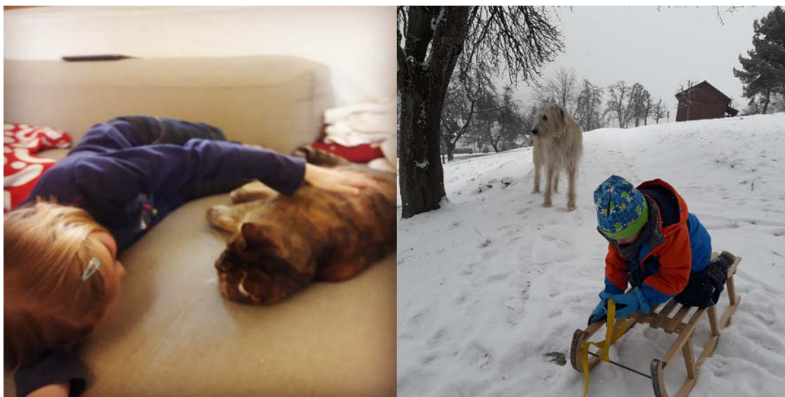
La nena amb un dels 3 gats que tenen .El nen i el gos de la família en trineu quan va nevar a casa.

Feia temps que havia sentit a parlar d'aquesta oportunitat i vaig decidir registrar-me a una pàgina web anomenada Aupairworld que posa en contacte famílies d'acollida i Au Pairs i és gratuïta.