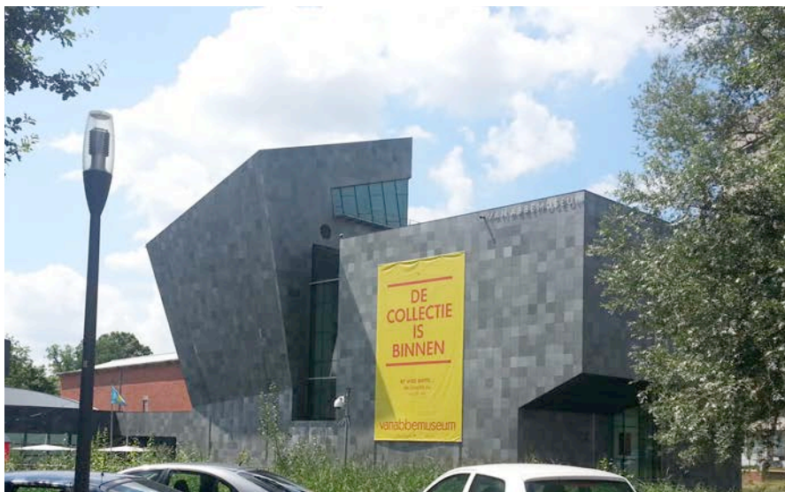
El Museu d'art contemporani Vanabmuseum a Eindhoven

Durant aquest temps he seguit desenvolupant els projectes en els que col·laboro. Està sent de gran ajuda les facilitats que hi ha en aquest país per a la creació d'empreses o simplement de ser autònom. Tot i que tota la documentació és en holandès, només has de pagar taxes si cobres. Per altra banda, a Holanda t'has de contractar una assegurança mèdica privada.