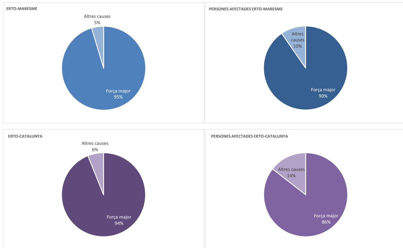
G.1 Percentatge d'ERTO i persones afectades per tipus d'expedient. El Maresme i Catalunya, 5 abril 2020